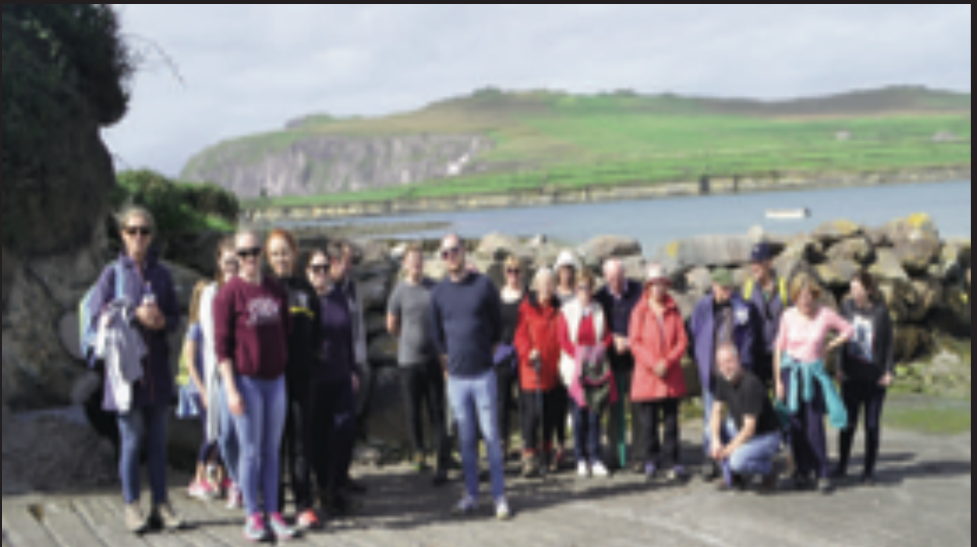
Siúlóid an Chéiliúrtha faoi stiúir Mhichil Uí Mainín