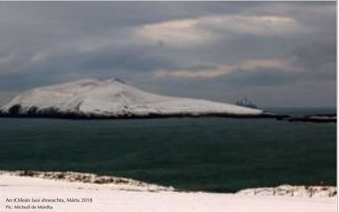
An tOileán faoi shneachta, Márta 2018